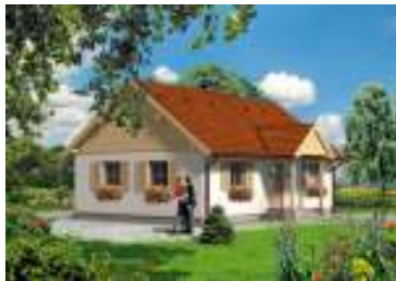
GL 58 WILGA