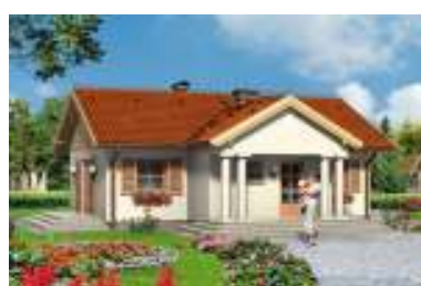
GL 225 MAŁY DWOREK