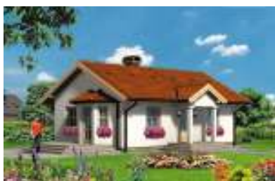
GL 152 TANGO